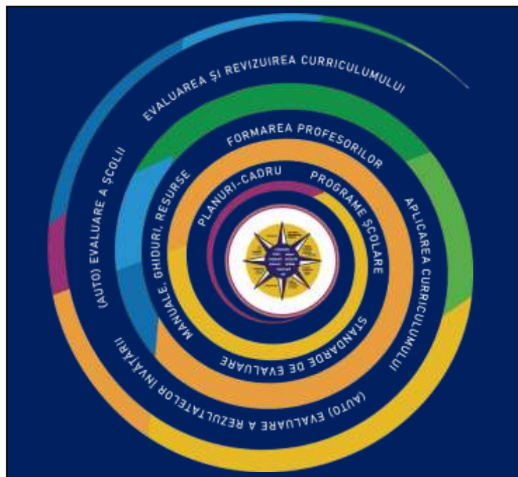
Figura 2. Continuumul predare-învățare-evaluare

În acest sens, profilul absolventului funcționează ca nucleu ce fundamentează, influențează și orientează constructul curricular, din perspectiva imediată a documentelor reglatoare, planuri-cadru de învățământ și programe școlare, precum și din perspectiva aplicării curriculumului: