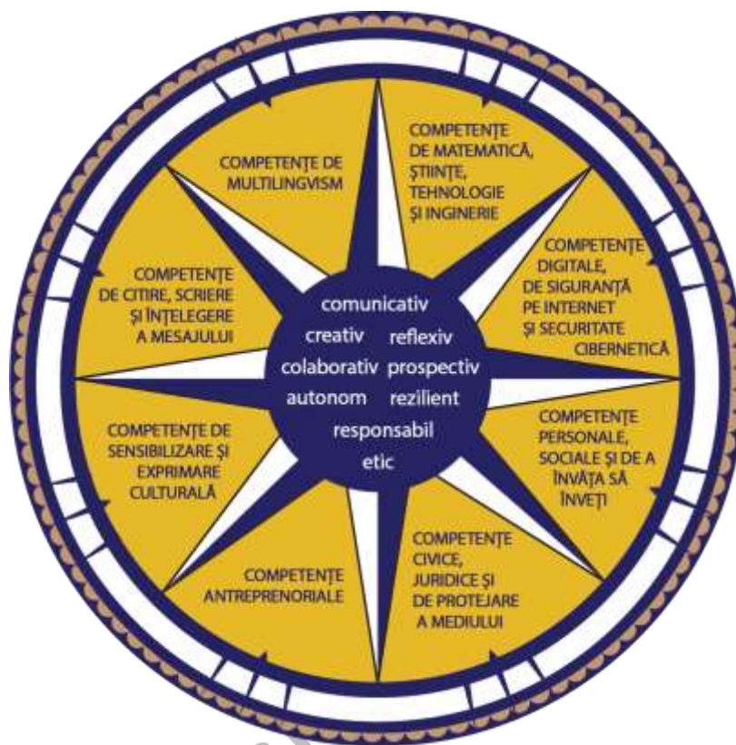
Figura 1. Dimensiuni principale care contribuie la definirea profilului de formare al absolventului

Profilul absolventului funcționează ca o busolă pentru întregul sistem educațional, în care elementele continuumului predare-învățare-evaluare conlucrează pentru realizarea idealului educațional definit în lege.