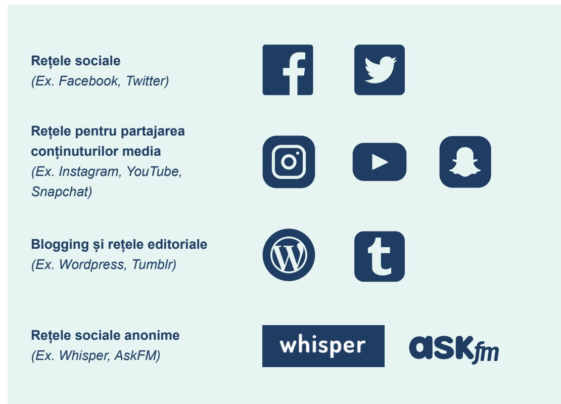
Figura 4. Câteva exemple de social media

Poate fi util, de asemenea, să se identifice diferite categorii de social media și să se discute despre cum anume funcționează, care este publicul țintă și de ce le folosește lumea. Social media include: