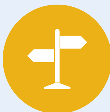
Profil și specializare