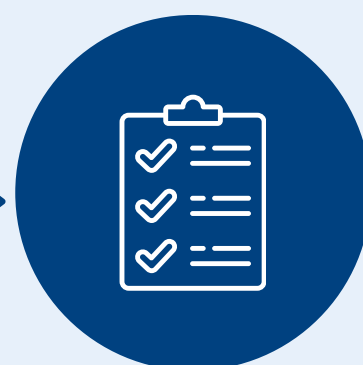
Probe adaptate profilului/ specializării